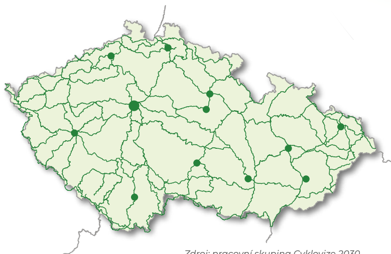
Zdroj: pracovní skupina Cyklovize 2030, aktualizováno ke 14. 6. 2023

K vybudování kvalitní dopravní sítě pro cyklisty je nutné přizpůsobit infrastrukturu tak, aby byla přímá, bezpečná, pohodlná a přitažlivá. Cyklovize 2030 chce přispět k tomu, aby se síť budovala a fungovala podobně, jako je tomu u železnic nebo silnic .